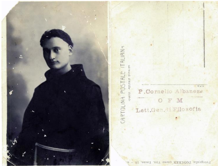
1915 ca.